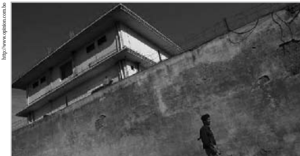
Imagen de la residencia en Abbotabad - Pakistán, donde fue abatido Osama Bin Laden por la fuerzas especiales estadounidenses.